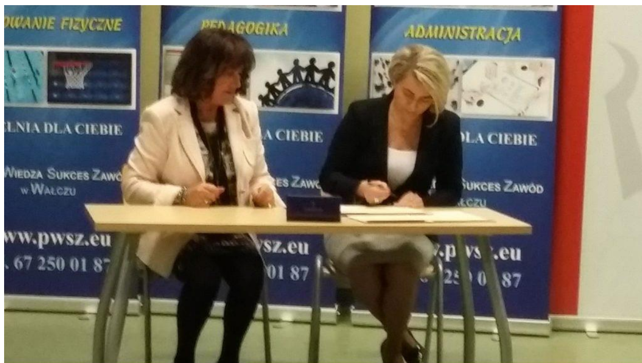
Podpisanie listu intencyjnego z PWSZ w Wałczu utworzenia Akademickiego Domu Opieki nad Osobami Starszymi ADOOS.